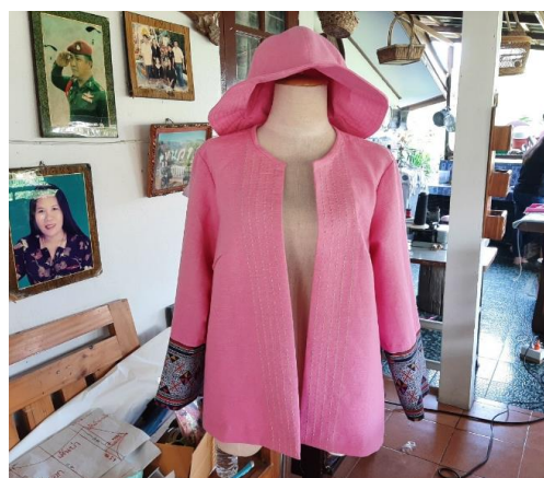
ภาพ : ส่งเสริมทักษะการตัดเย็บเสื้อผ้าให้กับกลุ่มตัดเย็บเสื้อผ้าปักหมู่ 4