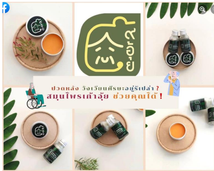
ภาพ : เพจ “สมุนไพรแก้ไอ” ( https://www.facebook.com/gaouuiherb )