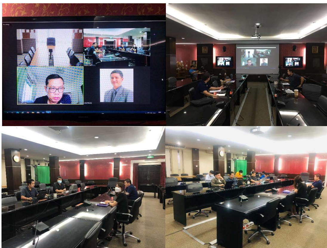
ภาพการประชุมคณะกรรมการดำเนินงานติดตามและประเมินผลการปฏิบัติงานการให้บริการสำนักดิจิทัลเพื่อการศึกษา ประจำปีงบประมาณ 2565 ครั้งที่ 1/2565 วันที่ 19 พฤศจิกายน 2565 เวลา 14.00 – 16.00 น. รูปแบบออนไลน์